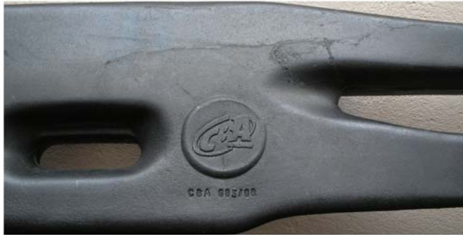
FOTO DA MARCA E DO NÚMERO DE HOMOLOGAÇÃO NA PROTEÇÃO TRASEIRA