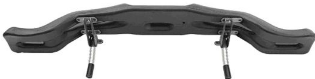
Foto da Proteção Traseira com os suportes

Essa ficha reproduz descrições, ilustrações e dimensões da proteção traseira no momento de homologação pela CBA. O Fabricante poderá modifica-las, mas somente dentro dos limites fixados pelo regulamento CIK e da CBA em vigor. Somente a ficha de homologação poderá servir para identificar um produto homologado.