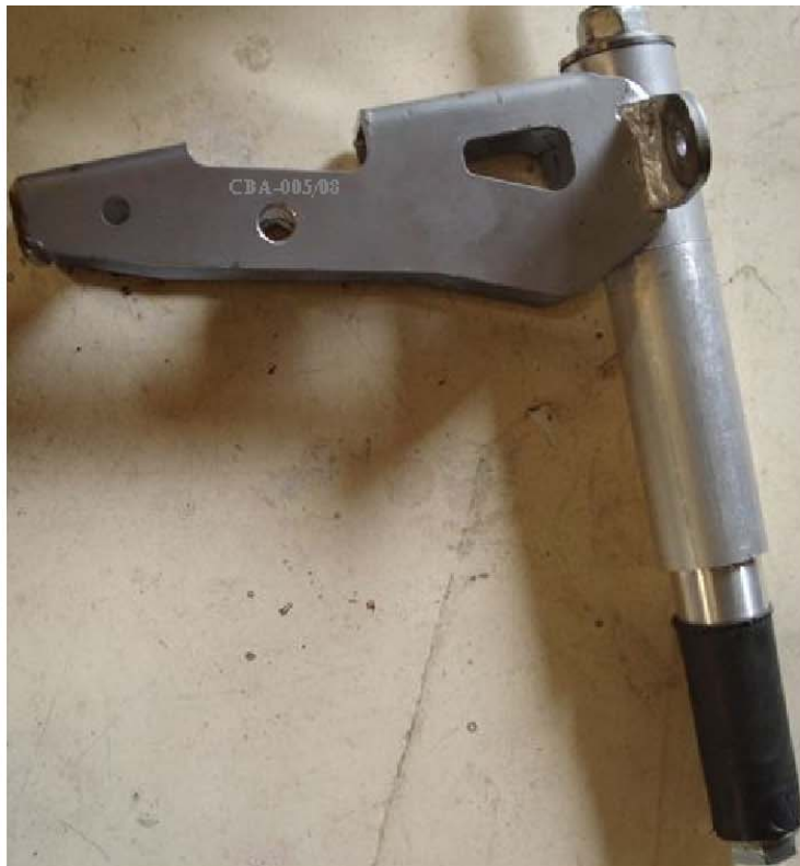
FOTO DA MARCA E DO NÚMERO DE HOMOLOGAÇÃO DOS SUPORTES